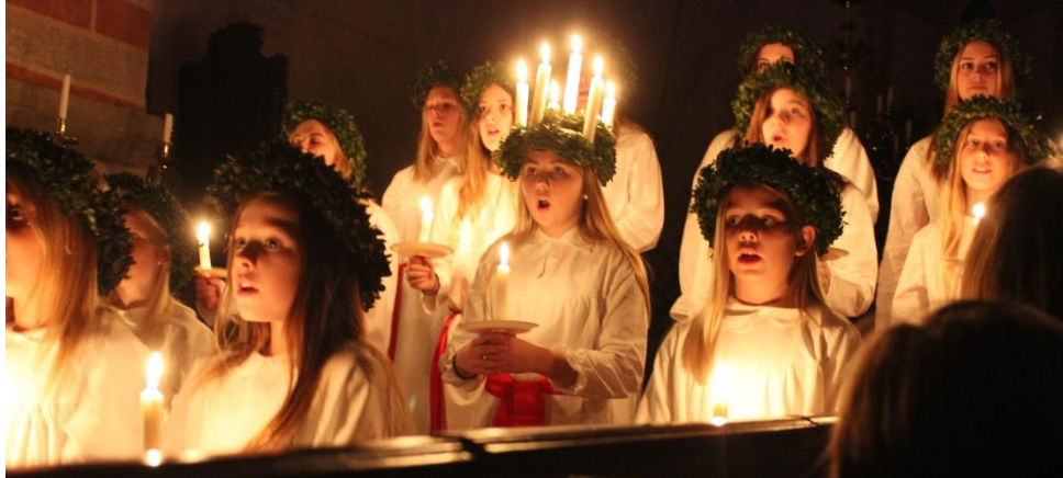
Inte bara bra fibernät på Näs. Bilden är från ett mycket uppskattat Luciafirande i en fullsatt Näs Kyrka den 12 december 2015